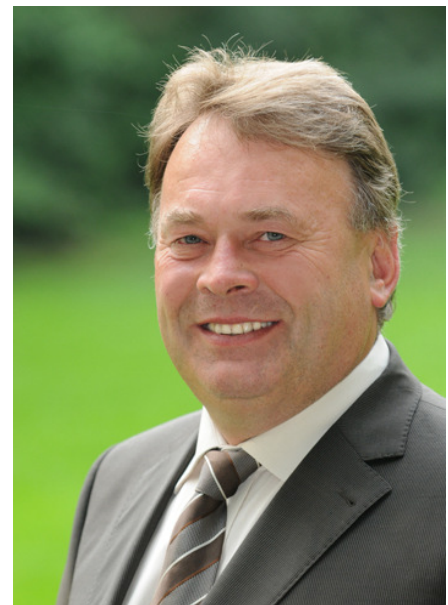
Staatsminister Helmut Brunner

mit diesem Gesetz wurde erstmals in der über 400-jährigen Geschichte der Ländlichen Entwicklung in Bayern eine eigene zentrale Behörde geschaffen, deren ausschließliche Aufgabe darin bestand, die Flurbereinigung zu leiten und durchzuführen.